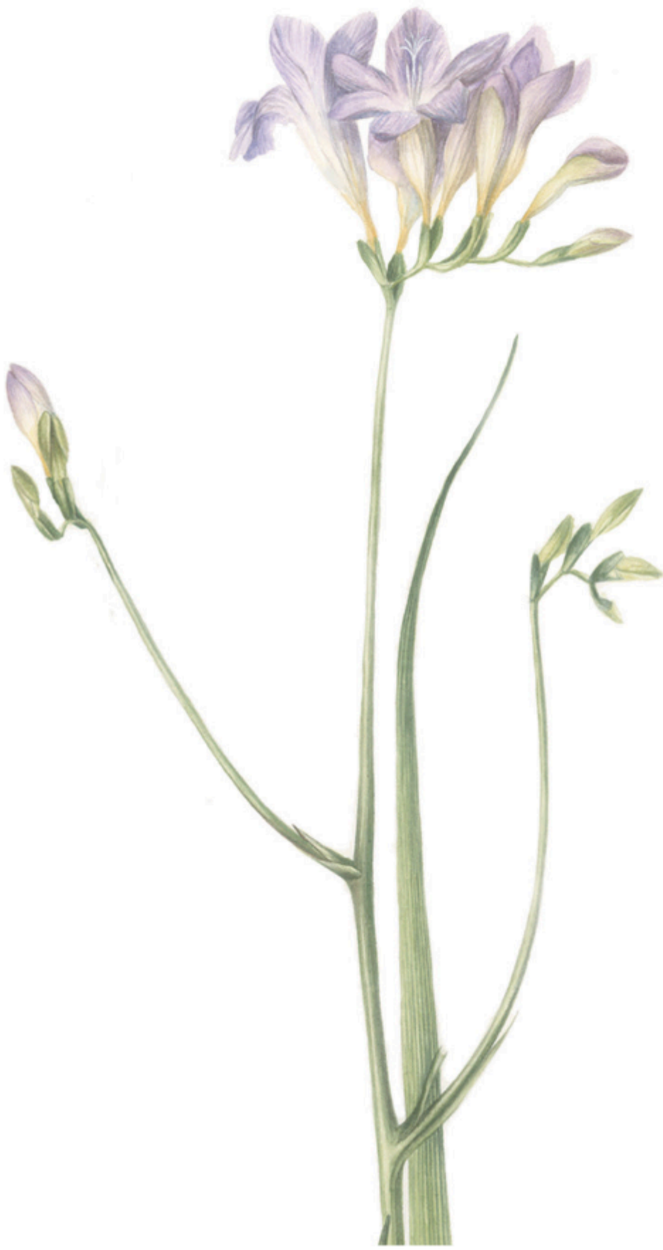
FIG. 3 Freesia refracta (Frezie)