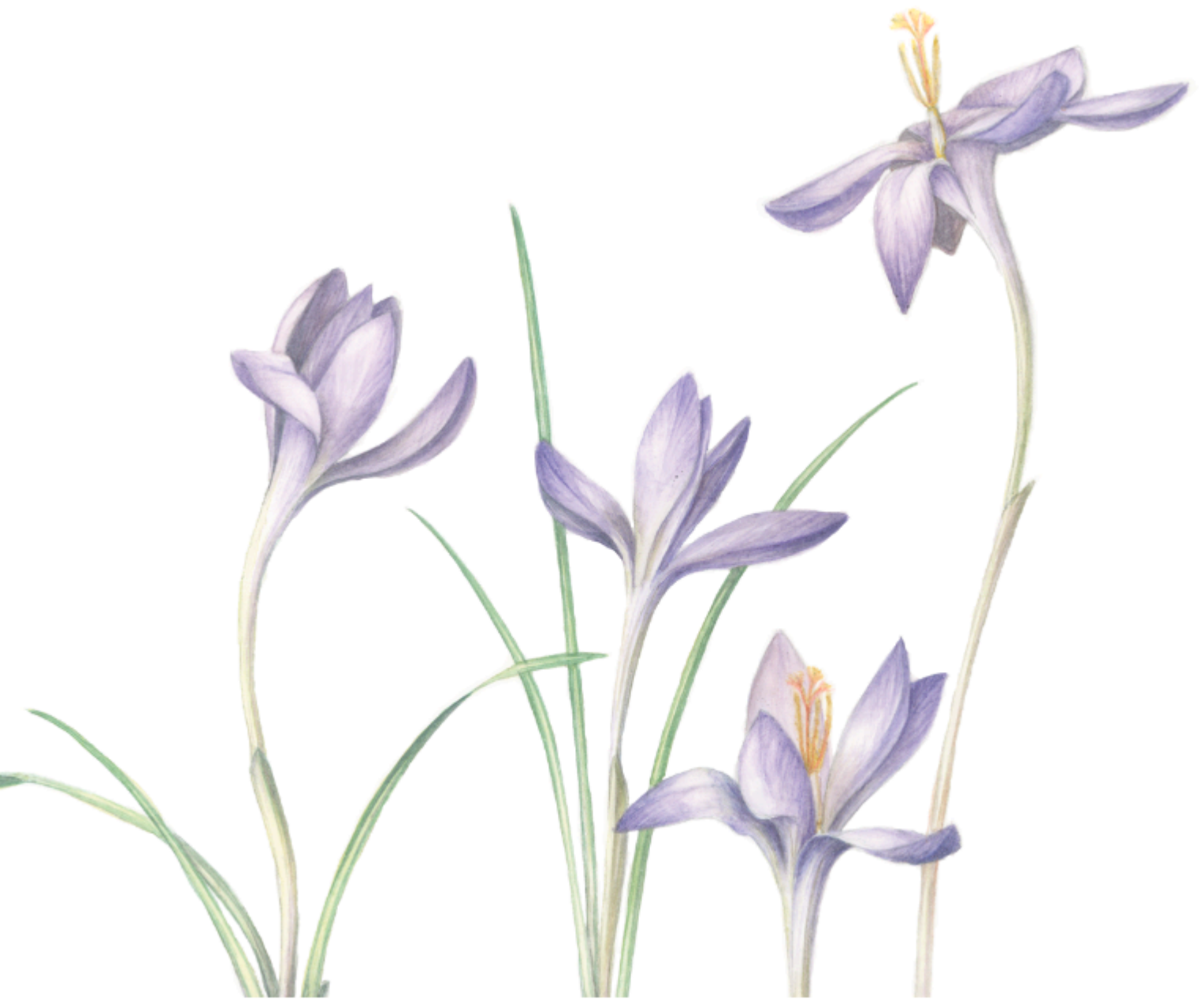
FIG. 1 Crocus vernus (Brândușă de munte)